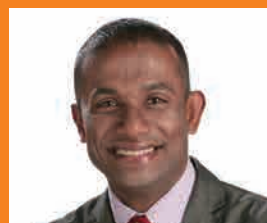
羽衣国際大学教授・タレント