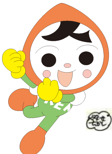
人権イメージキャラクター 人KENまもる君

講演会終了後、アンケートへの御協力をお願いします。 （講演会終了後メールを送信します。）