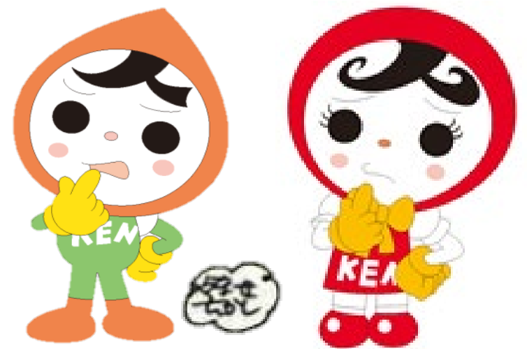
人権イメージキャラクター 人KENもちる君 人KENあゆみちゃん