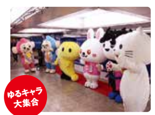
ゆるキャラ大集合

昨年、大好評だったドゥーストリオによる生演奏ステージや各種クイズ大会、輪投げ、ガラポン、はかりチャレンジ、スタンプラリー、ゆるキャラ大集合など盛りだくさん。小さなお子様からお年寄りまで家族で楽しめるイベントです！！